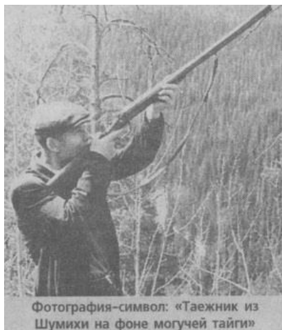
Фотография-символ: «Таежник из Шумихи на фоне могучей тайги»

Я удивился особому белорусскому выговору и неожиданным мыслям: разве есть разница - старожил ты или приезжий? В Атаманово всегда, выражаясь по-простонародному, жил «интернационал», и при чем тут фронт? Ведь мой отец и старший брат тоже служили.